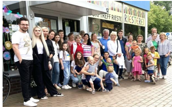
Kennenlernen und Austausch mit geflüchteten Ukrainerinnen und Ukrainern