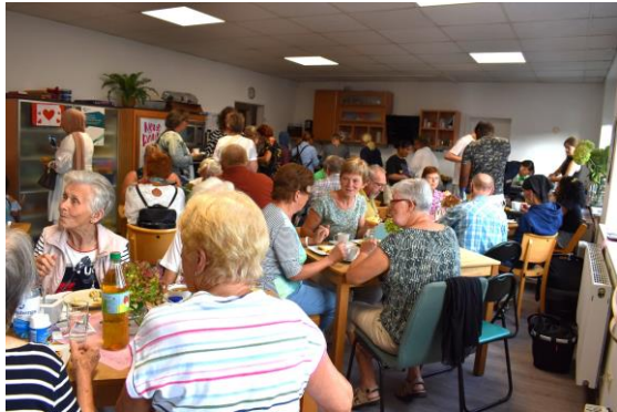
Feier zum 5-jährigen Bestehen