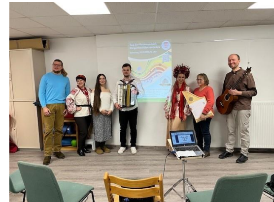
Tag der Hausmusik