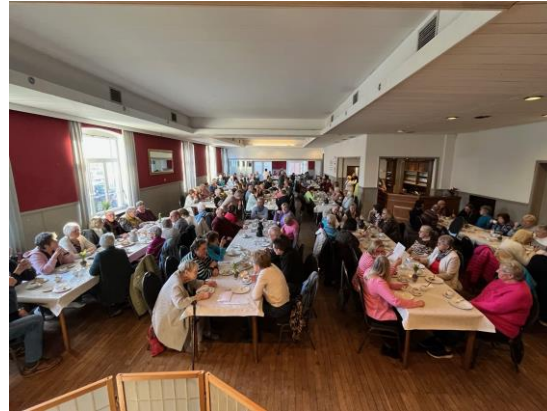
Seniorentheater in Alfhausen