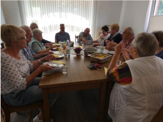
Mittagstisch im Dorftreff