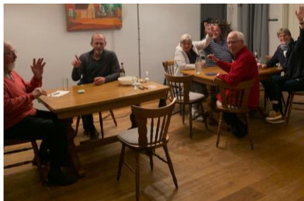
Karten spielen – Doppelkopf, Skat...