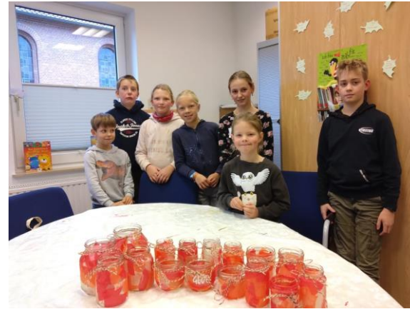
Bastelaktion mit Kindern