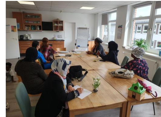
Spielerisch Deutsch üben