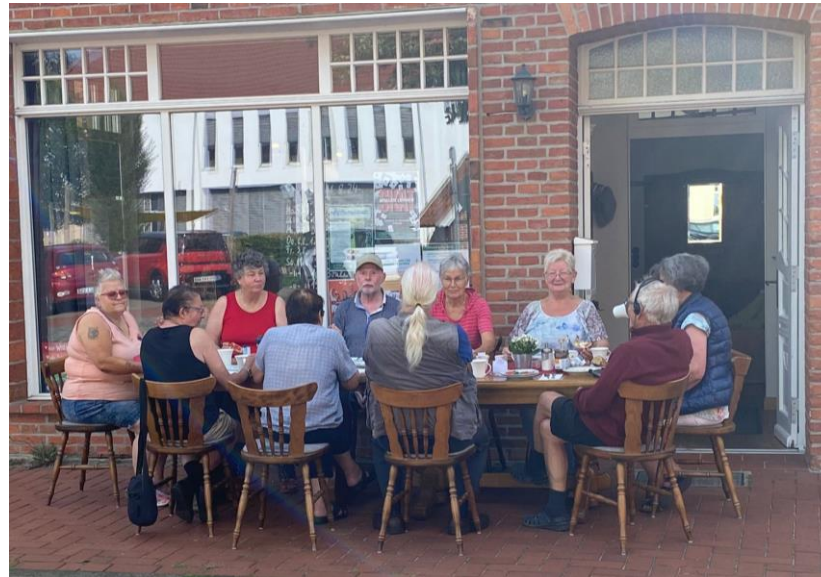
Frühstück geht auch draußen...