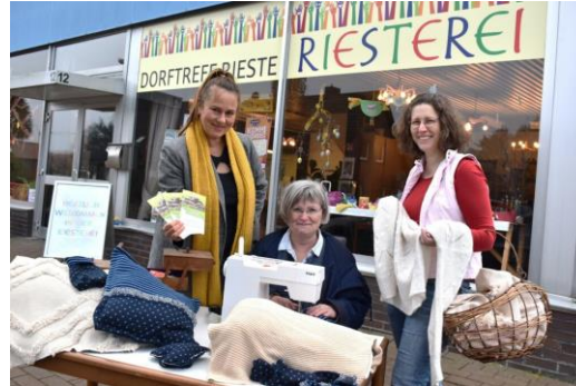
Upcycling-Nähwerkstatt – Kooperation mit Naturschutz- und Bildungszentrum (NBZ) Alfsee