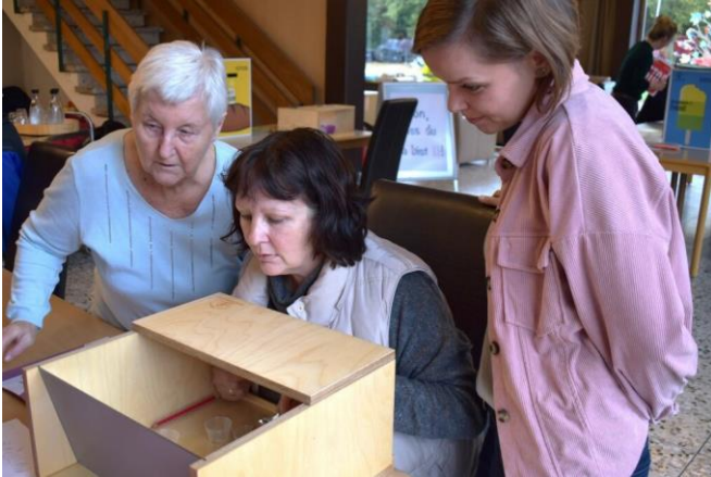
Demenzsimulator im Dorftreff Riesterei