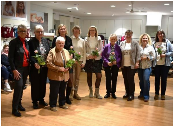
Vom Dorftreff organisierte und durchgeführte Modenschau „für den guten Zweck“!